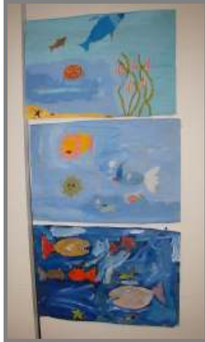
Lasten piirroksuvia Taidetalon seinällä