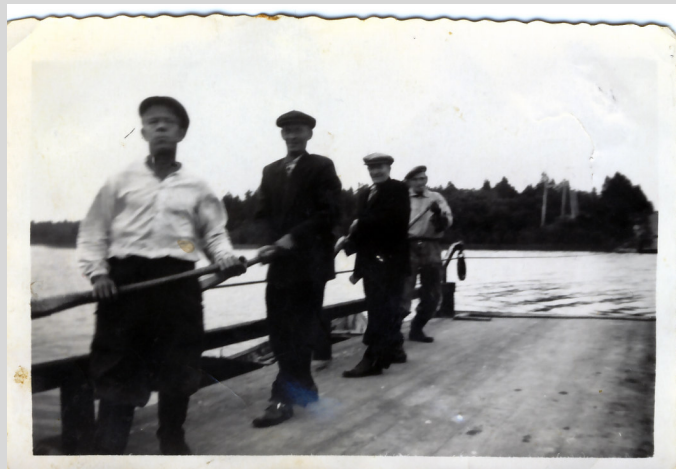
Kapulalossilla kulkijoita Käsämänsalmen lossilla 1950-luvulla