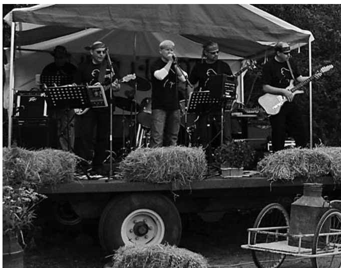
Huru-Ukot keikalla Sotkuman kesäpäivillä 2009