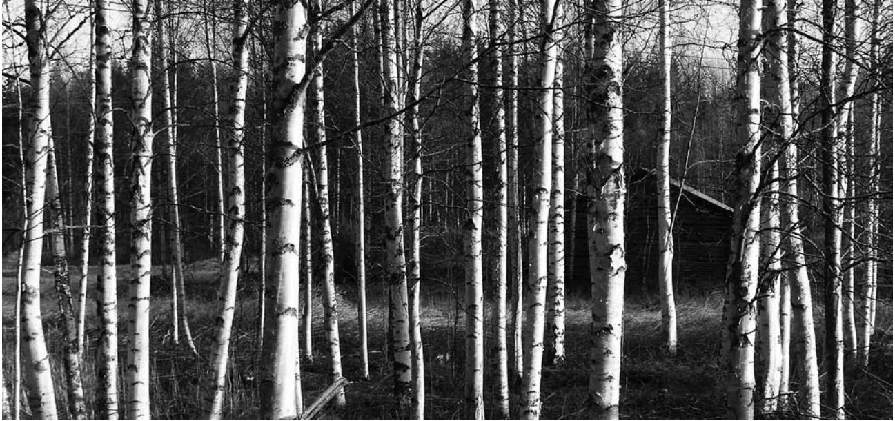
Tervalammen koivikkoa kirpeänä syyspäivänä 2009