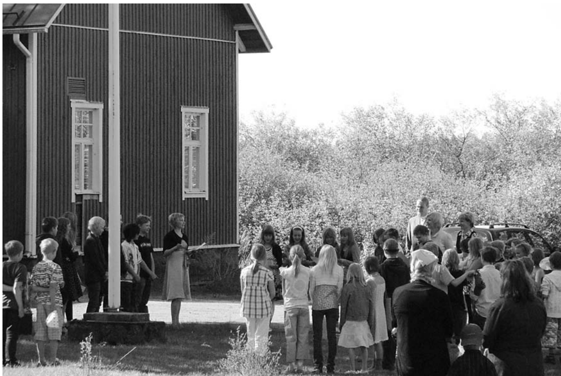
Sotkuman koululaiset kevätjuhlassa oman vanhan koulun pihalla 2009. Koulurakennukset olivat jo käyttökiellossa ja lapset kävivät kirkonkylän koulua. Vanha koulu purettiin syksyllä 2009 sisäilmaongelmien vuoksi. Uusi koulu rakennetaan samalle tontille.