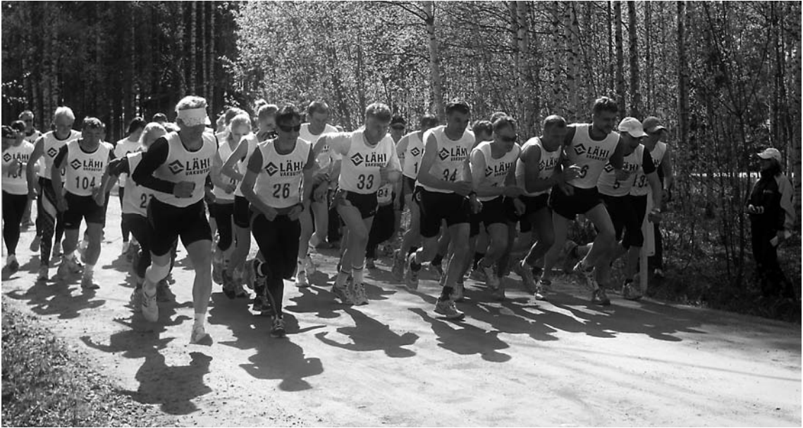
Sotkuman maastohölkän lähtö