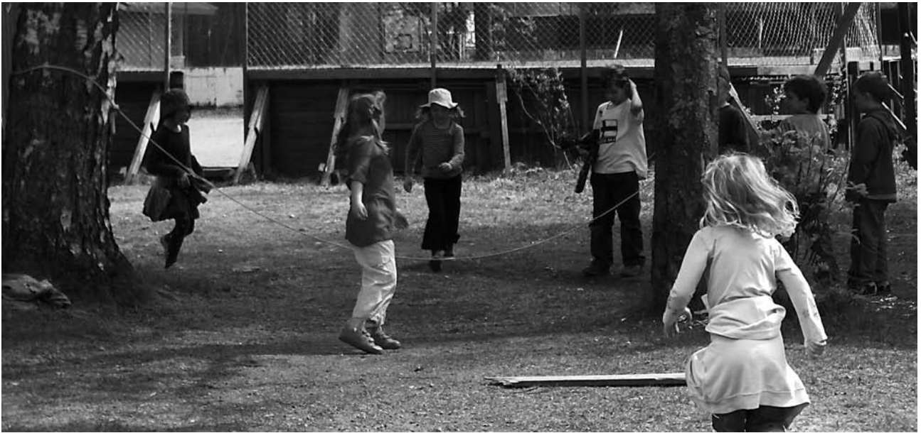
Sotkuman koululaisia välitunnilla toukokuussa 2008