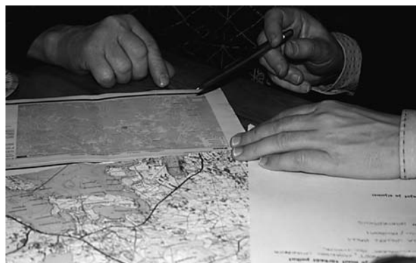
Ideointia karttojen ääressä

Ideota Sotkumassa riittää ja toteuttamiskelpoisia tulikin julki runsaasti. Ryhmätyöskentelyn päätteeksi kyläläiset äänestivät vielä mielestään parhaimmat ideat. Neljä eniten ääniä saanutta ideaa koottiin yhteen Top 4 -ideoihin. Näitä ideoita kyläläiset voivat toteuttaa tulevaisuudessa.