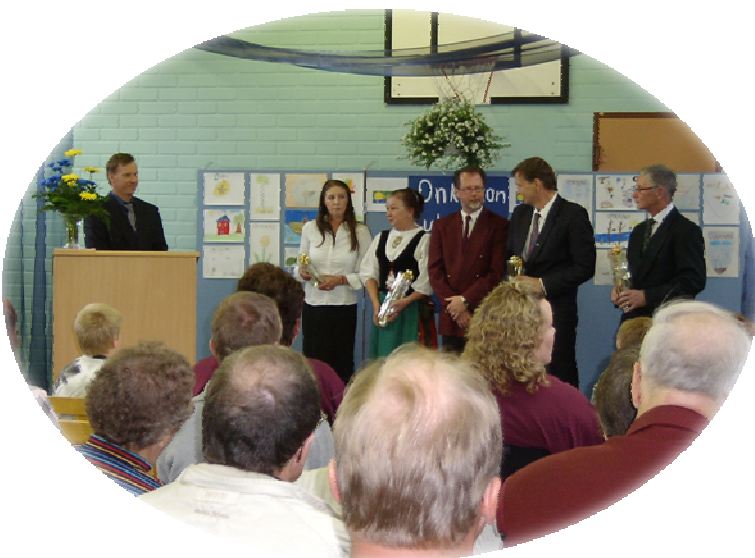
Kuvassa: Onkamon kyläjuhlat 2007 Onkamon koululla, jolloin kylätoiminta täytti 30-vuotta.