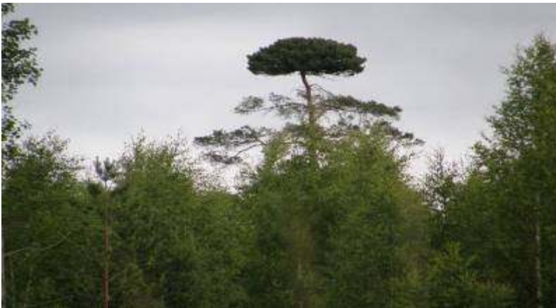
Kuvassa: Komealatvainen mänty Onkamon tanssilavan lähellä.

Rääkkylässä on meneillään selvitys Onkamojärven tilasta ja päästöjen vähentämisestä. Onkamon kylällä tehdään kyselyjä, onko mökkiläisillä mahdollisuuksia olla mukana kunnostushankkeessa omavaraisesti. Jokainen ranta-asukas voi halutessaan tukea hanketta 1000 eurolla. Onkamojärven tärkeimpiä kunnostustavoitteita ovat ravinteiden esto vesistöön ja ”rusukalan” eli roskakalan poisto. Alueen luonto ja ympäristö ovat Onkamon valtteja, joita kyläläiset haluavat vaalia ja hyödyntää monipuolisesti.