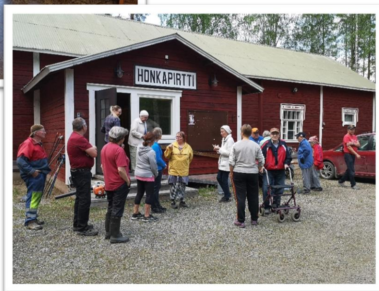
Kuvat: Kinahmon kyläillat 2023