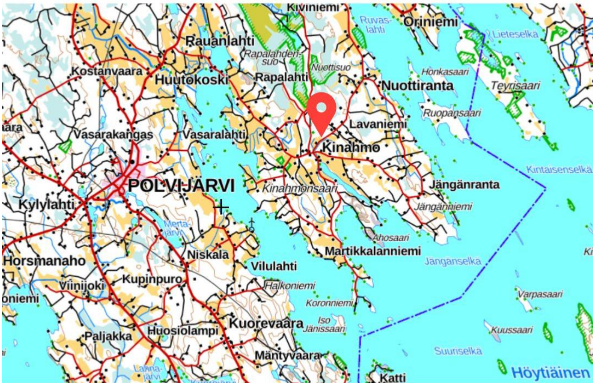
Lähde: MML, karttapaikka 2023

Kinahmon kylä sijaitsee Polvijärven itäosassa Höytiäisen rannalla. Kinahmonsaaressa muodostui Höytiäisen pinnan laskettua vuonna 1859 alavia peltoaukeita. Yhä tänään maatalous on tärkeä osa Kinahmon kylän elämää. Loivat rannat niemineen ja lahdellineen tarjoavat mahtavat puitteet kesäasunnoille. Kesäaikaan Kinahmon väkimäärä tuplaantuu. Kinahmo on hyvä paikka luonnosta nauttaville, sieltä löydetään maaseutumaisemia, peltoaukeita, metsiä, soita, harjuja ja hiekkakankaita sekä puhtaita vesistöjä. Kylän keskipisteenä ja kokoontumispaikkana on Honkapirtti, jota myös vuokrataan juhliin. Kesäisin kulttuuritalo teatteriesityksineen tarjoaa myös mukavat puitteet ajanviettoon. Lähde: kylät.fi