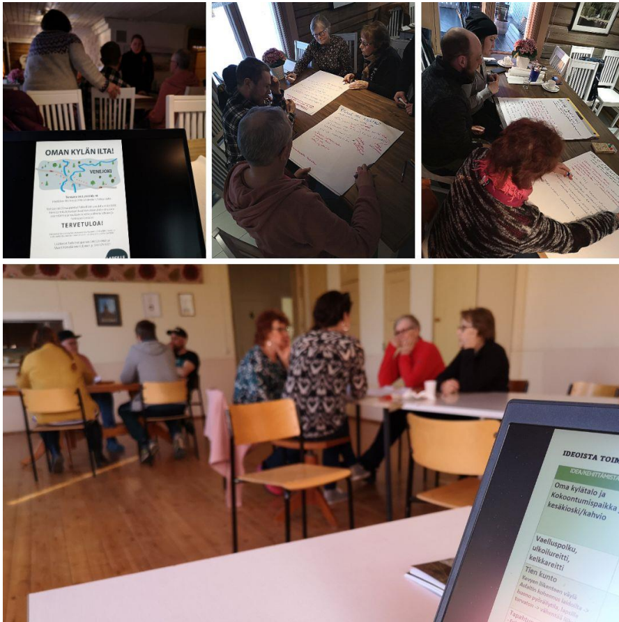
Kuvat: Venejoen kyläillat 2023